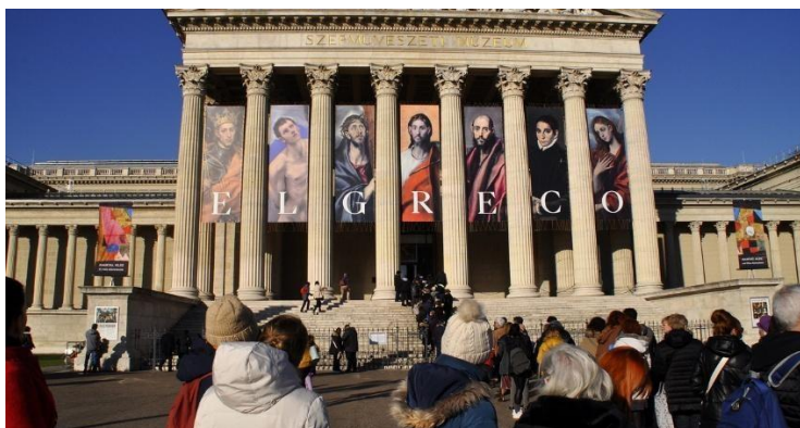
4. ábra Múzeumlátogatók a Nemzeti Galériában (Kovács, 2018, p. 112).